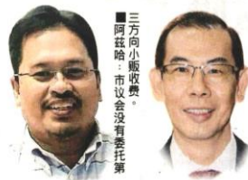
三方向小贩收费。阿任哈：市议会没有委托第三方。

他指出，该早市重开迄今约3周时间，目前一切顺利，小贩在经营方面也没有面对太大的问题。