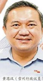
黄思汉(雪州行政议员)

他强调,州政府也期盼,通过这项计划能传达一个讯息,即是抗疫路上没人是孤单的。因此,他呼吁,有需要帮助的村民,勿觉得害羞或尴尬,要积极地联络村长,让“我们”来帮你!