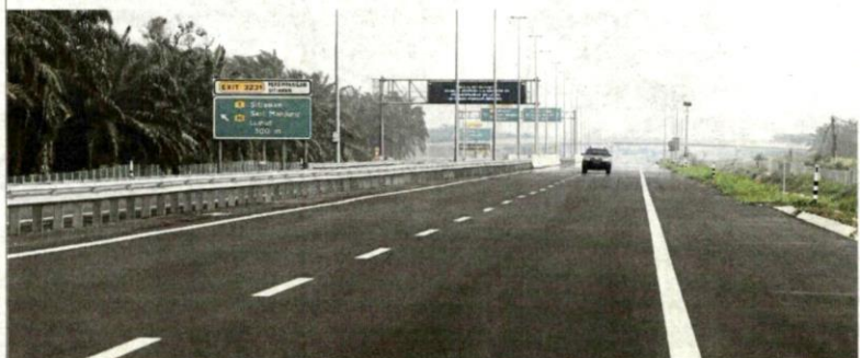
Penggunaan teknologi CMB bagi pembinaan jalan baharu dan penyenggaraan jalan raya di seluruh negara dapat membantu ekonomi pekebun kecil getah. (Foto hiasan)

Nasib golongan B40, khususnya pekebun kecil getah akan terus dibela kerajaan bagi memastikan komoditi berkenaan terus meningkat dan harganya kekal stabil.